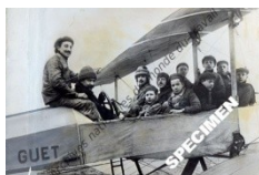
Carte n°2 : Avion Breguet avec moteur Gnome de 90 ch.