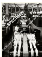
Carte n° 4 : Le peignage