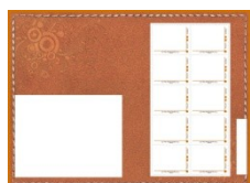
Planche de 10 timbres « Mon timbre à moi » représentant le bâtiment des Archives Nationales du Monde du Travail Visuel non disponible