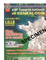
Carte n° 6 : Affiche du XXI e Congrès National de Généalogie Lille 2011