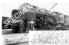
Carte n°3 : Locomotive Pacific 231. Photo et plan. Image non contractuelle