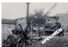
Carte n°1 : Locomobile tractant une batteuse